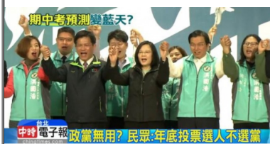
【中時電子報】 大選年「神預測」? 年底選舉藍綠6比4 (詳見全文)