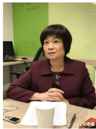
【自由時報】 政治檔案條例草案 保密期限逾30年視為解密 (詳見全文)