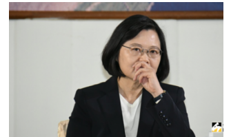
【今日新聞】 面對民眾怨聲不斷 蔡英文：那選我幹嘛? (詳見全文)